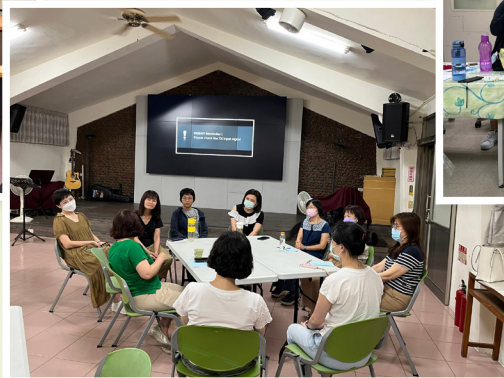
▲ 台南成大護福小組週三聚會