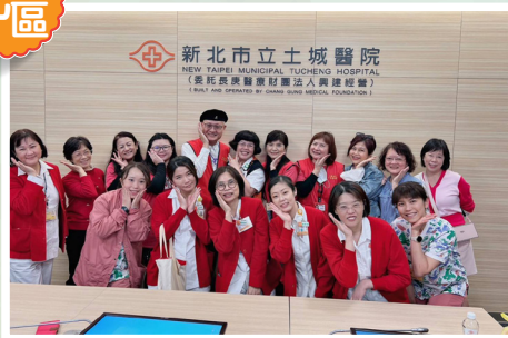
▲ 市立土城護理部新人關懷