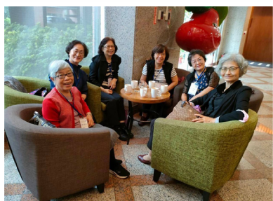
▲ 40周年慶早期契友相聚

感謝神，在護福，我們有共同的背景、語言，有共同的經歷，無論是歡樂、悲傷還是憂愁、壓力，可以被聽見、被同理、被接納。重要的是，還可以一起禱告。護福四十年，在數算恩典中，看見神的祝福是如此豐盛，在高山低谷中，神使我們不斷學習實踐信仰與專業，無論我們的人生走到哪個階段，我們都能成為與人同行並且祝福別人的人。