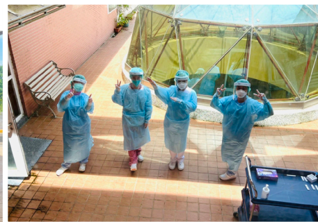
◀▲分院幫病人作快篩