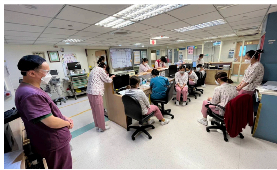
▲專責病房一起禱告

2021年國內新興傳染病COVID-19襲擊全球，病毒不斷的演變，考驗著全球公共衛生在防疫政策機動調節的必要性，台灣的警報響起，COVID-19成為國內醫療機構的強大敵人。中央疫情指揮中心播報確診現況，成為關注的新聞事件，雖為常態性說明疫情，每一個數字背後都隱含著全國各地區護理人員所要負擔的責任。醫療照護機構成為最前線抵擋病毒入侵的防線，只能全面迎戰且持守著不畏戰的心。COVID-19病毒的高傳染性造成人與人之間的恐懼及害怕，在醫院環境裡難免也出現複雜的情緒及衝擊。醫院啟動防疫指揮中心，各個團隊整備應戰，對於護理部大家長而言，如何帶領護理大軍迎向戰場的確不是件容易的事情，保持警醒一點都不能鬆懈，步步為營，戰戰兢兢，時時顧念基層護理人員身體健康及心靈需要。從一開始新冠疫苗預防注射業務，接續設置社區快篩站，醫院各個病房區也都嚴陣以待。由2022年4月底開始進入病毒威脅階段，面臨社區感染的開始，護理的戰場亦隨之轉