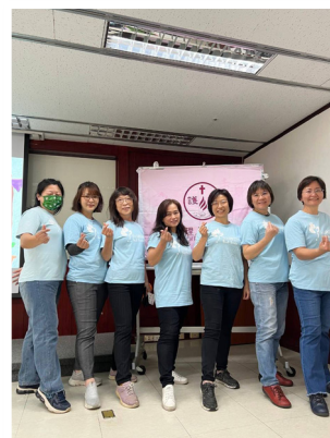
▲ 40周年慶林口長庚敬拜團