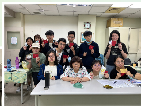
▲ 長榮大學靈性護理課程