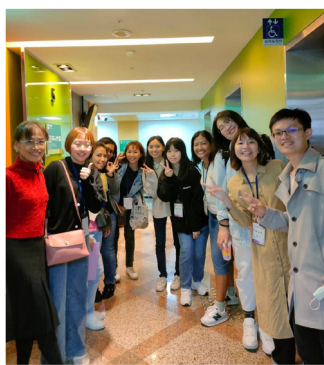
▼ 40周年慶新世代小組聚集