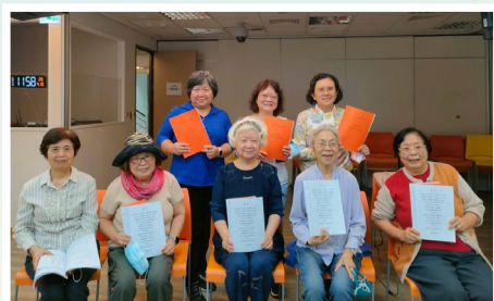
▲退休護理人員內在生活中小組活動