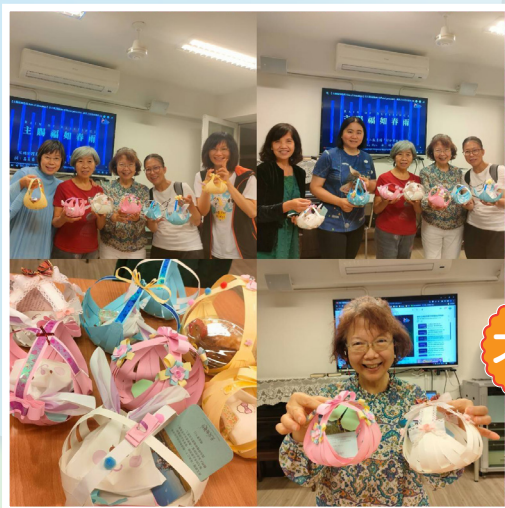
▲北區復活節生命如花籃月聚會