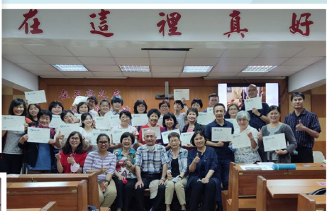
◀基隆安樂教會鹽水課程