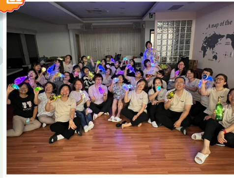
▲護師節長庚跨院區護理人員點燈傳承聚會