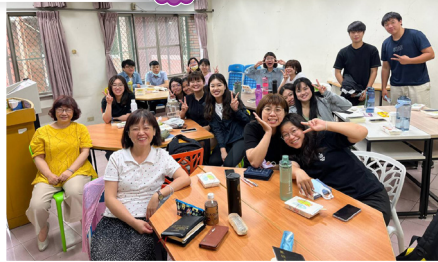
▶護福台南長榮大學學生小組