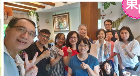
▲國軍花蓮總醫院幸福小站週五中午線上職場禱告祭壇聚會