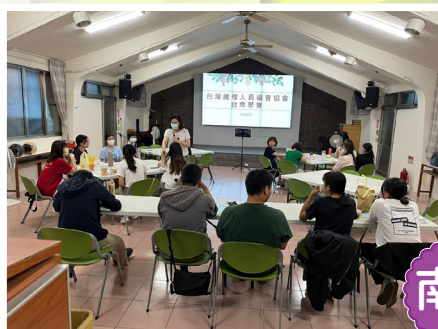
▲台南成大護福小組週三晚聚會