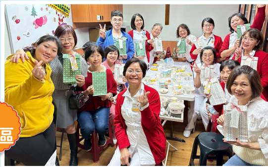
▲林口長庚護理長聖誕福音特會