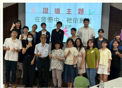
▲南區天主堂護福聚會