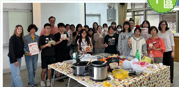
▲台中科大英文查經班