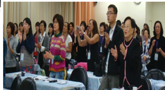
▲護理人員福音協會成立三十周年紀念