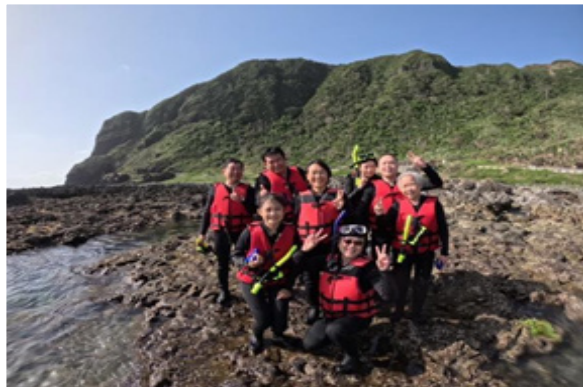
▲蘭嶼獨特的藍，等待獨特的你