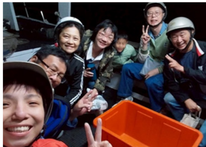
▲浮潛與夜撈行程讓大家刺激又開心