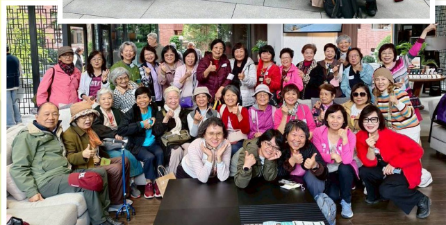
▲退休小組戶外聚會、退休護理人員聚會