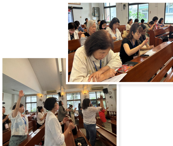
▲會中的敬拜與禱告

目前離職潮中，離開的往往是這群經驗豐富的護理人員。高工時、高壓力，加上各院之間為