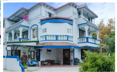
▲秀華經營的埔里惟特力莊園民宿：545 南投縣埔里鎮崇文三街35號