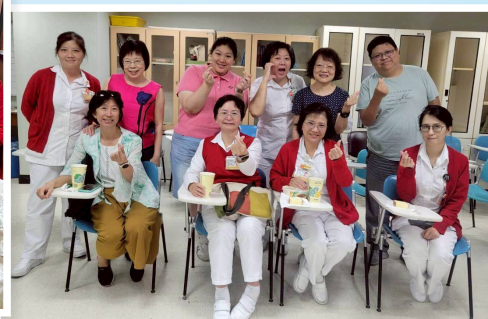
▲長庚護理長關懷會