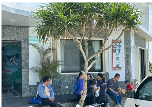
▲民宿前的涼亭，是我們歡聚的地方