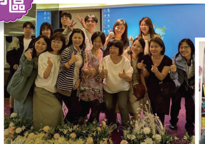
▲南區會友退修活動會