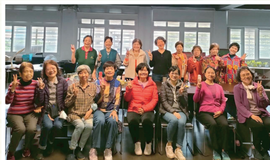
▲退休護理人員月聚會