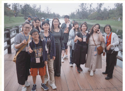
▲退修會琵琶湖健走