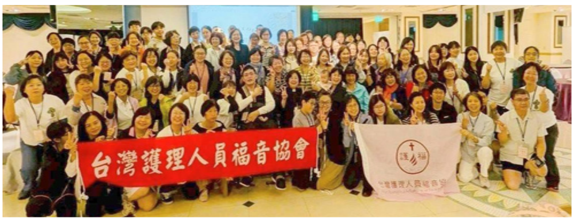
▲ 2025 護福台東退修會

我們的生命是有使命的，每個人的生命景況不同，有些人在病痛中、在患難中。我們自己的工作處境也許也艱難，有許有不友善的老闆、天兵的同事、琢磨人的病人……，但是，在病痛時、生命的陷落時、挫敗時、有時是領受神、親近神的時刻，心理不要害怕，共同承擔、一起努力，職場傳福音，使人得福，我們有神做靠山！