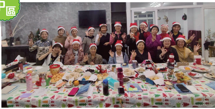
▲中區護福年終感恩