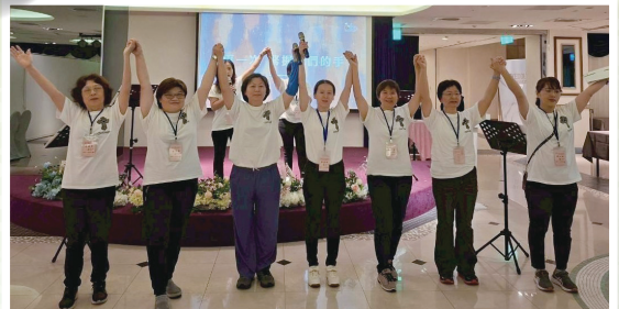
▼東區恩多社慈濟大廳獻詩